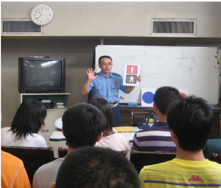
交通ルールや道路標識についての説明に耳を傾ける研修生達。

今回はアジア研修センターでの日本語集合研修中に行なわれる受入れ団体主催の講義の様子をレポートします。受入れ団体様の講義の中には行政機関のご協力を得て行なう交通安全・防犯講義、防火・防災講義の公的な講義があります。当センターでは会場の提供・関係機関との連絡調整、また通訳の手配等を通して、研修生達の日本語学習以外の研修もサポートしています。今回は去る7月6日、小山警察署からお2人の講師をお招きして行なわれた交通安全・防犯講義の様子をご紹介します。