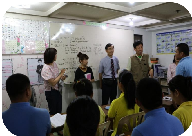
当校講師と実習生の交流会