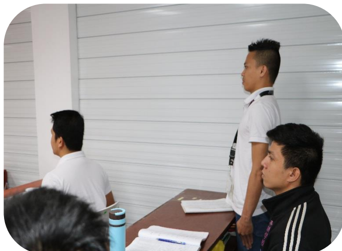
将来の夢等を大きな声で発表する実習生