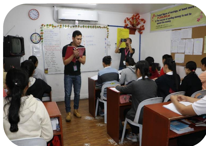
熱心に日本語授業をするフィリピン人先生