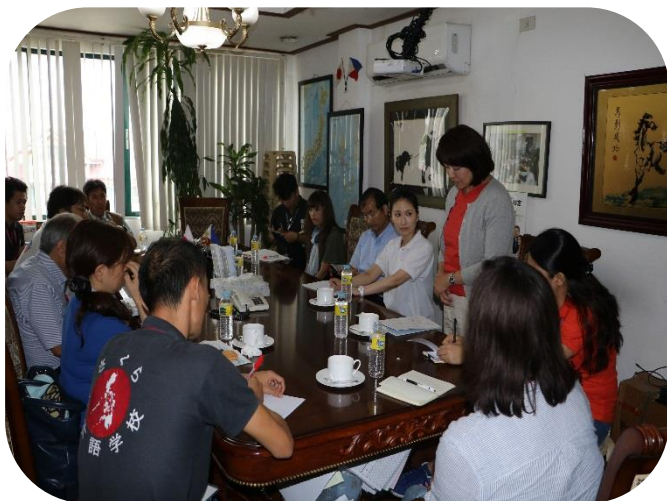
現地の日本語講師と本校講師の意見交換会

今回のこの貴重な経験を活かし、これからも実習生の皆さん、現地の家族、関係者のみなさんの気持ちを大切に、実践的な日本語コミュニケーション力の育成に、講師・スタッフ一同、取り組んでいきたいと思えます。