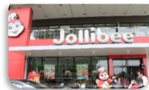
フィリピンで一番人気の ファストフード店「ジョリビー」