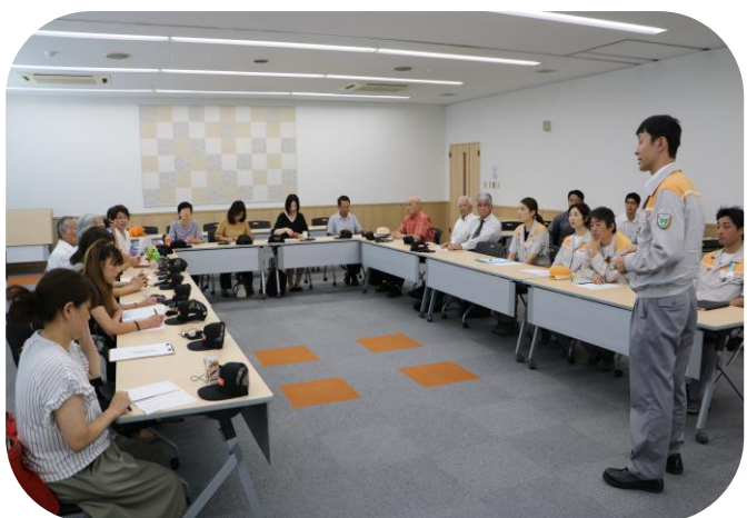
工場見学の後は、講師からの質問答えていただきました。