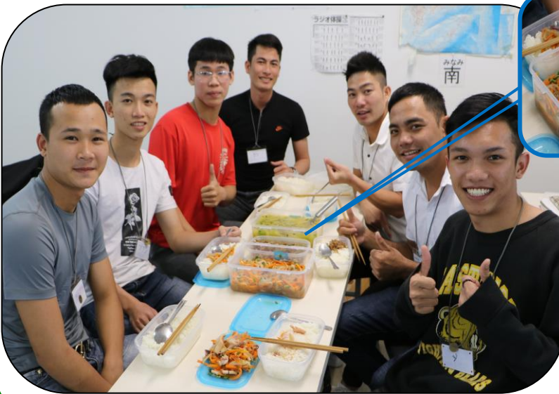
おかずを囲んで楽しいランチタイムの始まり!