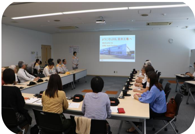
見学前の担当者からの実習生受入体制の説明

これからも「技能実習生のための実践的な日本語教育」を推し進める為の一環として、実習実施機関への見学会を積極的に行なっていきたいと考えておりますので、これからもご理解・ご協力、どうぞよろしくお願い致します。