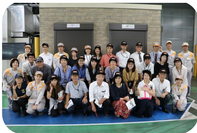
実習生・実習生担当の皆様との記念撮影。皆さん、本当にお世話になりました。

※当校ホームページ http://www.ajiken.jp/ から「あじけん通信」バックナンバーもご覧になれます